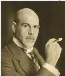
Walther Rathenau (1867-1922)

Der Antisemitismus blieb in Gesellschaft, Kirche und Staat bestehen. Der Historiker Heinrich von Treitschke ersann am Ende des 19. Jahrhunderts die Parole: „Die Juden sind unser Unglück!“ Fortwährende Feindseligkeit und Benachteiligung prägten das Bewusstsein der deutschen Juden.