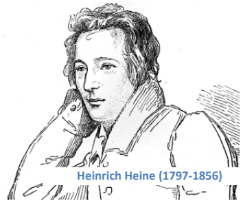
Heinrich Heine (1797-1856)

Im 19. Jahrhundert nahte mit der Aufklärung, deren Grundsätze von den Truppen Napoleons gewaltsam über den Rhein transportiert worden waren, die einsetzende Gleichberechtigung der deutschen Juden. Nun begann die Gelehrsamkeit vieler Hebräer, sich